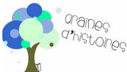
L'actu de la MIK