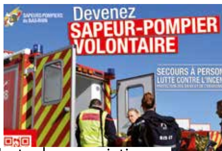
L'actu des associations